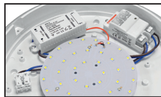
Connecteur rapide double entrée