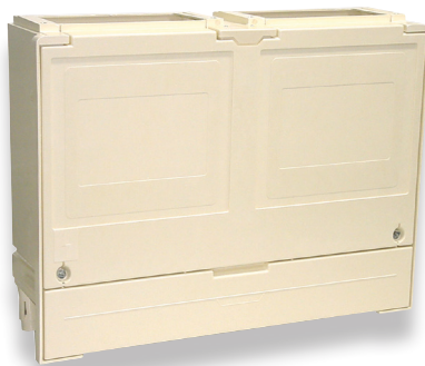
Socle double S20 (N006)