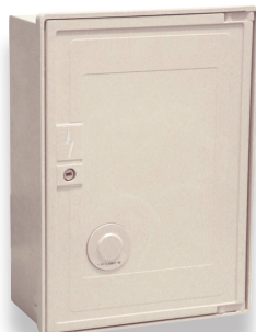
Coffret S20 nu avec embase de téléreport (N002)