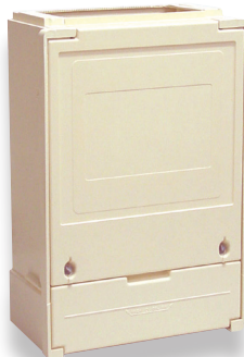
Socle simple S20 (N005)