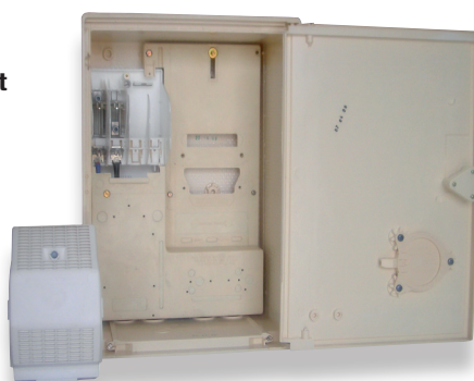
Coffret S20 MONO/TRI + panneau avec embase de téléreport (P535)