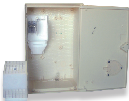
Coffret S20 MONO/TRI avec embase de téléreport (P533)