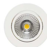
Blanc mat Mat wit