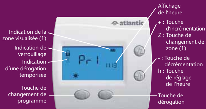
Modèle Fil Pilote

Un confort pièce par pièce ou zone par zone