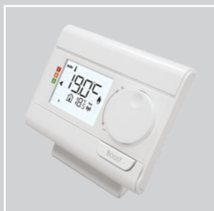
Télécommande digitale radio fournie (voir page 46)

La télécommande digitale radio fournie dispose d'un écran de grande dimensions rétro-éclairé blanc pour faciliter l'accès aux réglages et leur visualisation. Le réglage est simple, direct et intuitif.