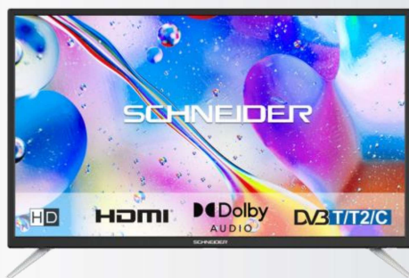
SCHNEIDER TV 32" / 80 cm HD

Élégant et polyvalent, ce téléviseur offre toutes les caractéristiques pour apprécier un bon moment de cinéma.