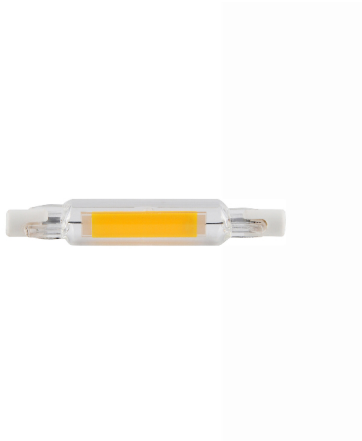
Ampoule R7S 78 MM COB 4W 450Lm 2700K